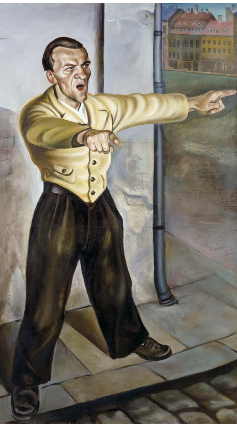
CURT QUERNER, DER AGITATOR, 1931 GEORG SCHOLZ, CAFÉ (HAKENKREUZRITTER), 1921

Die thematisch angelegten Räume führen verschiedene Orte und „Szenen“ zusammen, die bislang getrennt voneinander betrachtet wurden. So entsteht im Überblick der zahlreichen unterschiedlichen Stilprägungen ein klares Gesamtbild, das bis zur deutschen Wiedervereinigung zerrissen blieb – mit Brennpunkten, die bis heute Gültigkeit besitzen.