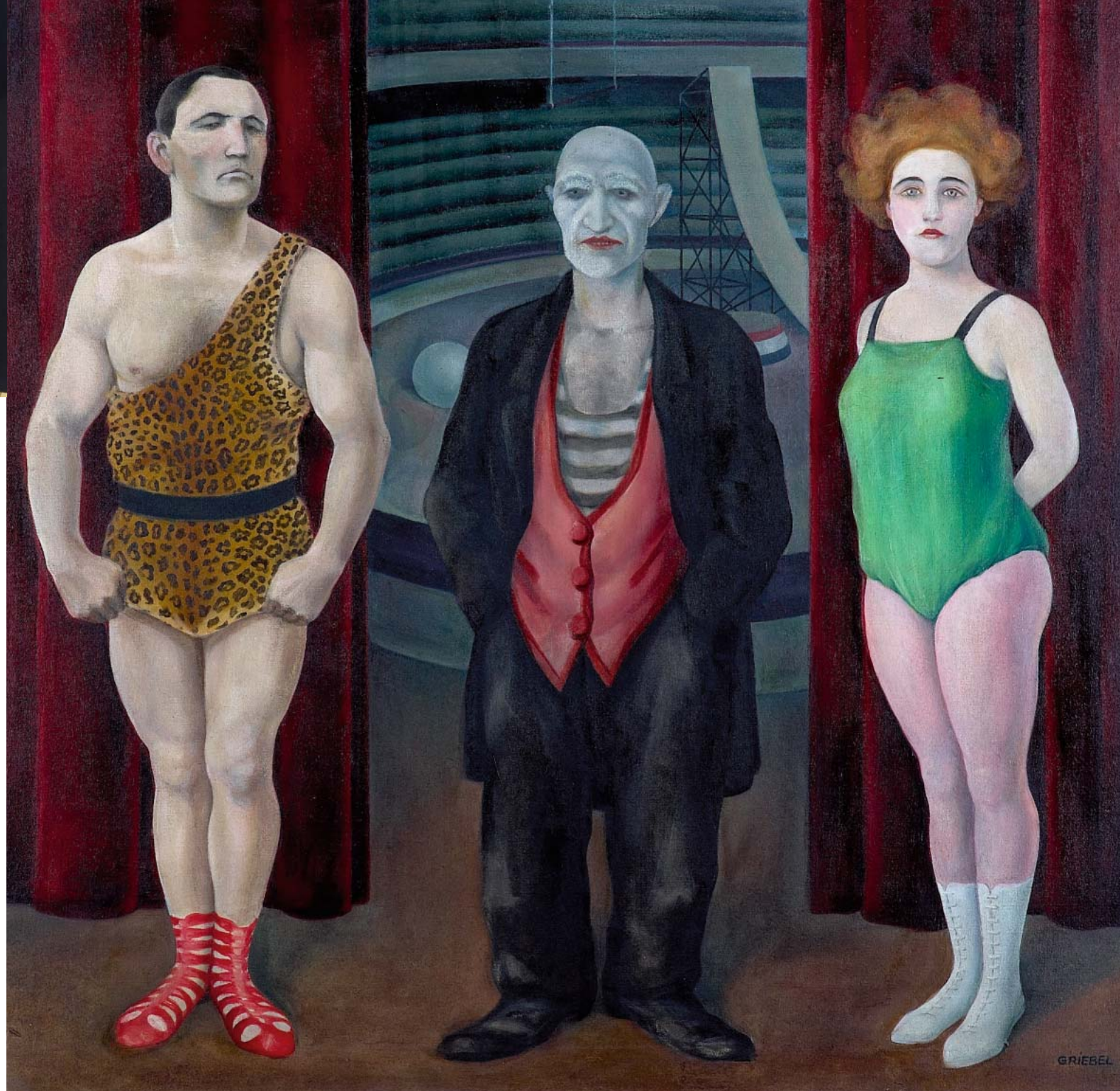
OTTO GRIEBEL, ZIRKUSBILD, 1925