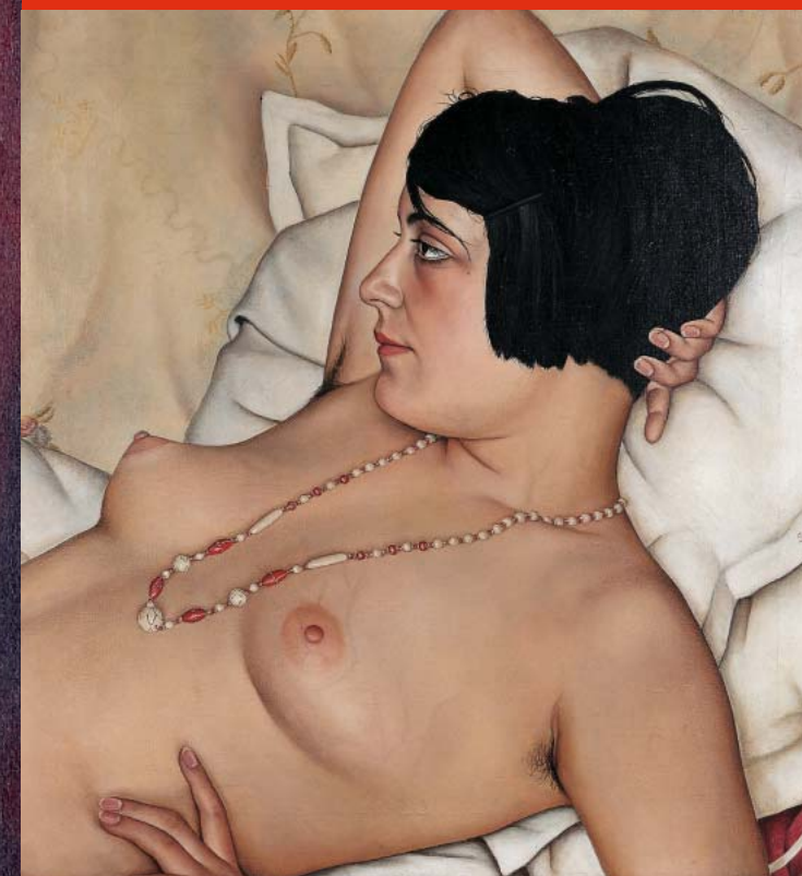
CHRISTIAN SCHAD, HALBAKT, 1929 RUDOLF SCHLICHTER, MARGOT, 1924